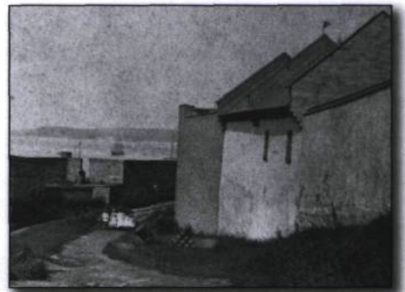
La rue des Remparts. vers 1880.