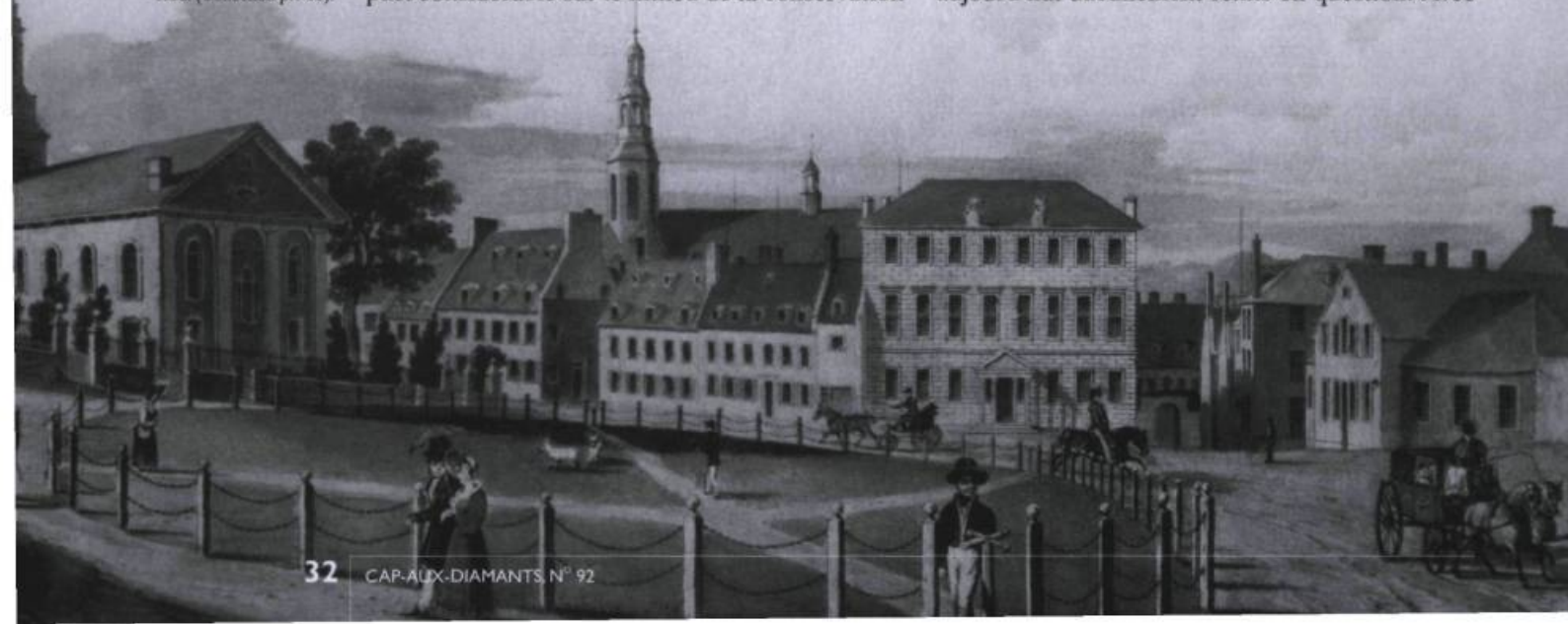
■ Place d'Armes ou le Rond de chaîne. Dessin de Robert Auchmuty Sproule lithographié par C. Hullmandel, 1832. (Collection privée).

Avec un recul de près de 30 ans, on peut aujourd'hui affirmer que cet ouvrage a eu un impact considérable sur le milieu de la conservation