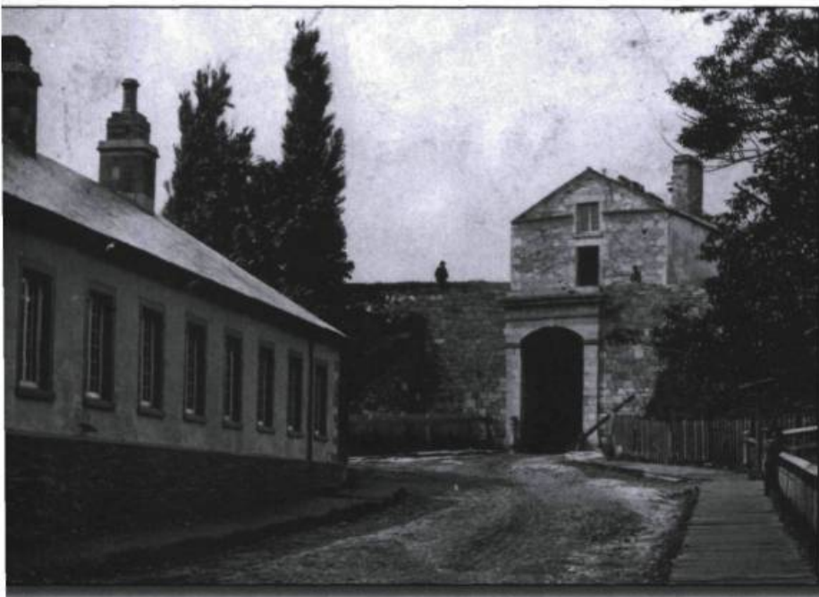
■ La porte Saint-Louis, vers 1871.