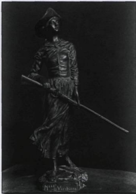
Canada. M lle de Verchères, par Hébert. Carte postale ND Phot, 1908, n° 409. (Collection Yves Beauregard).