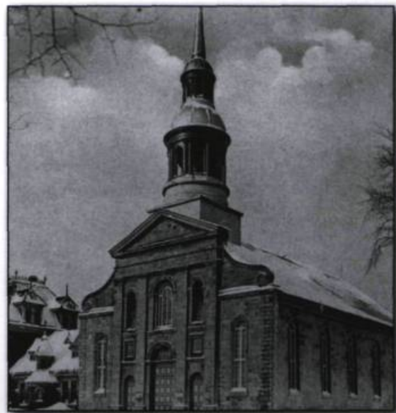
Saint-Hyacinthe. Église Notre-Dame. Carte postale ND Phot, 1908, n° 595. (Collection Yves Beauregard).

Reconnus pour leur habilité à reproduire les châteaux, les églises et les sites historiques, le ministère de l'Instruction publique et des Beaux-Arts leur accorde le droit d'exploiter la collection du Service des monuments historiques en 1898. Ce droit exclusif comprend le tirage et la mise en