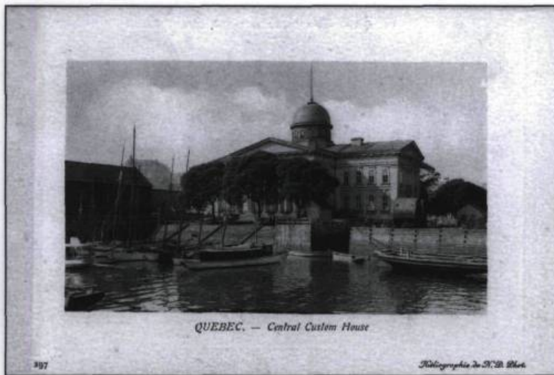
QUEBEC. — Central Custom House