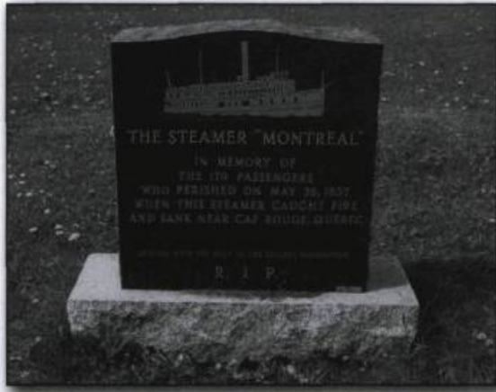
Monument élevé en 1982 dans le cimetière Mont-Royal. (Archives de l'auteur).

Les journaux de l'époque, notamment Le Canadien , La Minerve , Le Journal de Québec , le Québec Mercury , Morning Chronicle , et L'Ère nouvelle fournissent de nombreux renseignements sur les victimes et les survivants de l'incendie du Montréal . Les témoignages entendus à l'enquête du coroner et rapportés dans ces journaux permettent de reconstituer les événements. Le 24 septembre 1857, le St. Andrew's Society Charitable Committee a déposé un bilan des sommes reçues lors de souscription populaire en faveur des rescapés et indique l'usage qu'il en a fait. Les archives judiciaires ont conservé de l'enquête du coroner et du procès, les citations à comparaître, la liste des prisonniers, des témoins et des victimes.