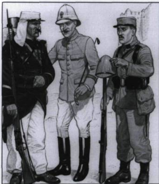
Légionnaires lors de la campagne d'Afrique du Nord de 1903-1911.