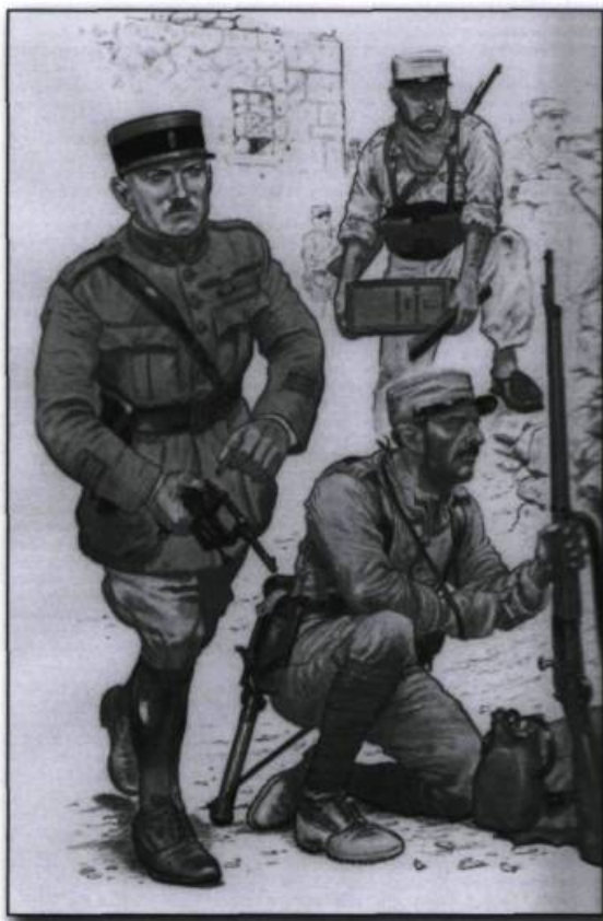
Légionnaires au Maroc (1920-1935).