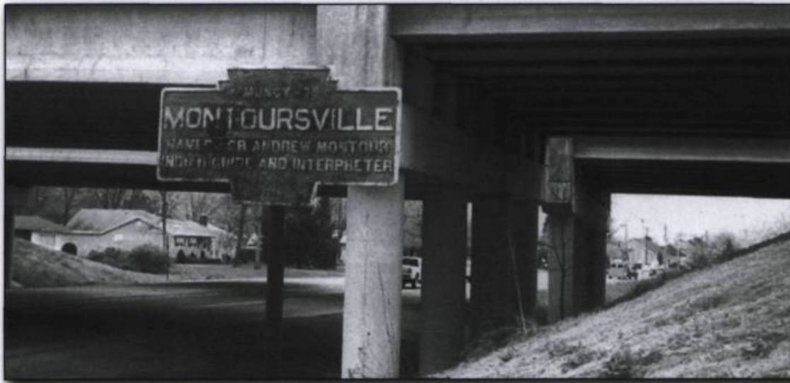
Montoursville (Pennsylvanie, E.-U.). Fondée en 1768, cette ville porte le nom d'Andrew Montour. ( www.gribblenation.com ).