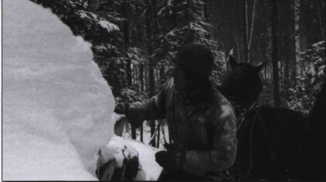
■ Bûcherons de la Manouane (1962), court métrage d'Arthur Lamothe. Le plus beau film sur le froid, montrant sobrement la situation difficile dans les camps de bûcherons de la Mauricie, à la fin de 1961. Le commentaire neutre cachait une analyse critique du quotidien des bûcherons. (Photo ONF, Archives de l'auteur).

Durant la même période à Montréal, au Saint-Denis et au Bijou, on pouvait assister à d'obscurs mélodrames aux titres suggestifs : La Cabane du péché ( Il nido di falasco , 1950), film italien de Guido Brignone, ou encore La Nuit des suspects , film français de Victor Merenda aussi connu sous le titre Huit femmes en noir , avec la chanteuse montréalaise Guylaine Guy dans un rôle mineur (Voir Le Petit Journal du 18 septembre 1960 et le Montréal-Matin , le jeudi 1 er septembre 1960, p. 17). Parmi les films étrangers présentés en salle au Québec, en 1960, on trouvait parmi les plus populaires : la version en français de Ben-Hur (1959) de William Wyler, et Hiroshima mon amour (1959) d'Alain Resnais, dont la version projetée au Québec avait été réduite de treize minutes par la censure (d'après Lever et Pageau, 2006, p. 93).