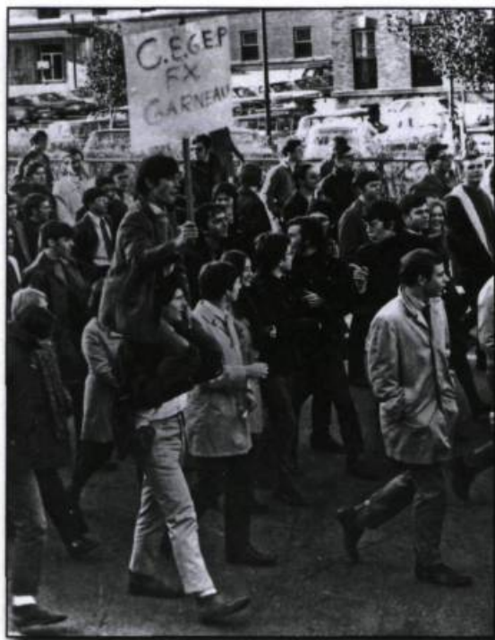
Manifestation des étudiants du cégep François-Xavier-Garneau, vers 1965. (Bibliothèque et Archives nationales du Québec, P 428/PN/21).

la revendication de l'autogestion dans certains cas. Tout devenait prétexte à une contestation globale de la société québécoise dans ses structures, dont sa dépendance économique. L'atmosphère était à la contestation.