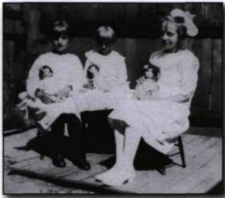
Au pays des enfants, redécouvrir dans une armoire vitrée, les poupées de jeux d'une époque révolue.

C'était le périlleux chemin des pionniers du Far West, la piste sinueuse des cowboys texans, les terres ancestrales des Sioux, lieu d'embuscades des Iroquois, de Radisson, Des Groseilliers, et des Apaches en peintures de guerre.