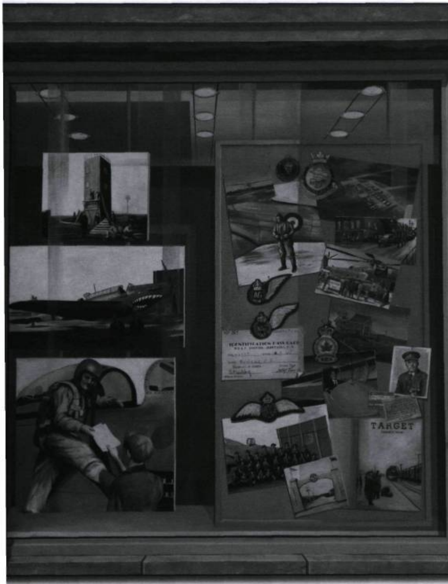
Murale dévoilée récemment pour rappeler la 9 e École de bombardement et de tir de Mont-Joli pendant la Seconde Guerre mondiale. (Photographie Rémi Sénéchal, 2006).

Pour les métiers plus militaires, comme bombardier et mitrailleur aérien, il fallait bien s'en remettre à l'expertise militaire. Comme les besoins en personnel cadre étaient importants, on avait tout avantage à créer de grandes écoles d'aviateurs afin d'optimiser les ressources. C'est pour cette raison que les écoles de bombardements et de tir étaient les plus grandes du programme.