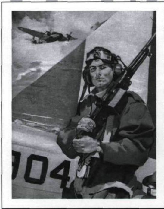
Mitrailleur aérien devant son appareil d'entraînement, en 1942.

Le Québec eut une part modeste des installations du PEACB. En plus de la très imposante 9 e École de bombardement et de tir de Mont-Joli, le PEACB installa une école d'observateurs aériens à l'aérodrome de L'Ancienne-Lorette, une école préparatoire d'aviation à Victoriaville, des écoles élémentaires de pilotage à Windsor Mills, Pendelton, Saint-Eugène, une école de pilotage militaire à Saint-Hubert et en-