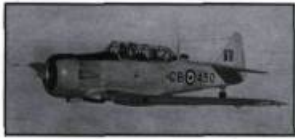
Le plus connu des appareils de PEACB, le Harward. (Archives de l'aéroport de Mont-Joli).

Sous-traiter avec des organismes civils pour la formation des pilotes était une nécessité incontournable. En effet, les délais requis pour mettre en marche toutes les écoles du PEACB empêchaient une progression normale des effectifs. Pas le temps d'engager des instructeurs pilotes et de les faire progresser, même en accéléré, dans le système militaire. Il valait mieux engager des compagnies de transports, même des écoles privées de pilotage (comme à Victoriaville) et les mandater pour la formation du personnel. Évidemment, seuls les métiers « civils » de l'aviation, comme la navigation et le pilotage, permettaient cette approche.