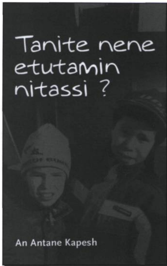
An Antane Kapesch. Livre réédité en format papier et en format CD. Il est écrit avec l'orthographe uniformisée et lu par plusieurs personnes issues de dialectes différents. (Archives de l'auteur).

Si on veut que la langue innue perdure, il faut l'utiliser, s'assurer de pouvoir la transmettre oralement aux générations futures, la chanter, la parler à la maison, mais aussi l'enseigner à l'école et la faire entendre dans les salles de spectacles. De nos jours, une langue risque moins de disparaître si elle est écrite par les gens qui la parlent. Un adage ne dit-il pas Les paroles s'envolent, les écrits restent! La langue innue est un symbole très fort : elle est là, maintenant, sous forme écrite pour assurer sa pérennité.