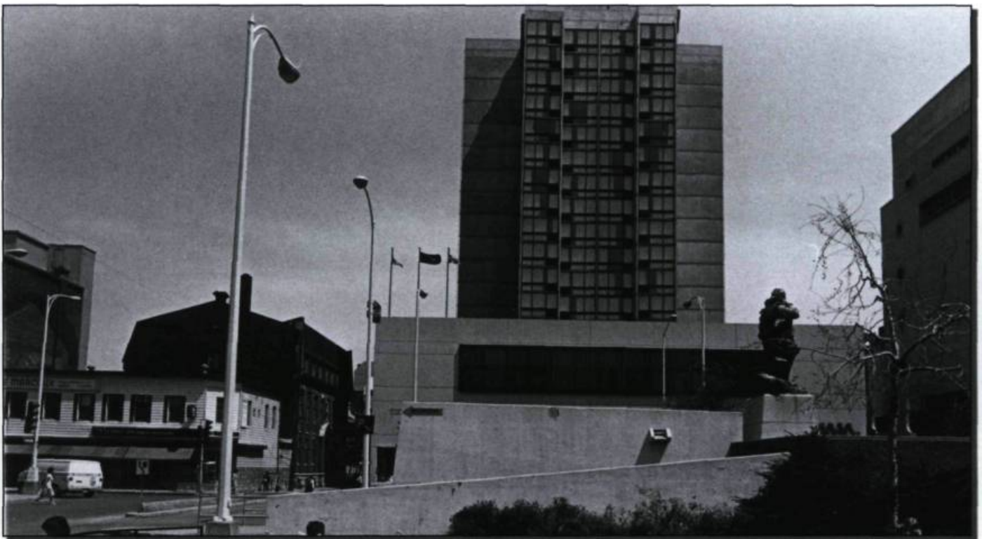
Construite en 1974, à l'entrée du nouveau Mail Saint-Roch, la tour de l'hôtel Holiday Inn est aussi une initiative visant à revitaliser le centre-ville.

Le gouvernement du Québec ne limite pas sa vision de Québec à une capitale administrative. Il y voit aussi un lieu de mémoire important où doit être mis en valeur le passé français identitaire de la nation québécoise. Le gouvernement se permet donc d'intervenir dans la sauvegarde du Vieux-Québec, le constituant en arrondissement historique, en 1963. Déjà, dans les années 1950, la Commission des monuments historiques, un organisme provincial, avait restauré les maisons Chevalier et Jacquet. En 1965, la Chambre de commerce crée la Société de la Place Royale pour la rénovation du quartier, impliquant les gouvernements provincial et fédéral. Mais, le gouvernement du Québec décide