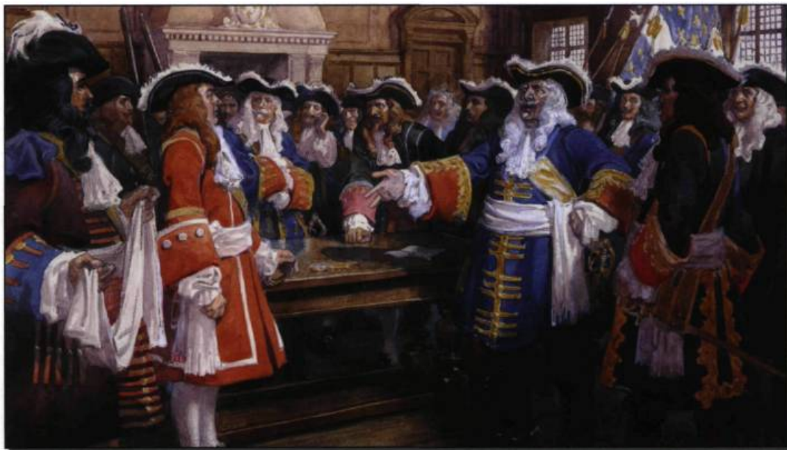
■ Frontenac recevant l'envoyé de sir William Phips venu demander la reddition de la ville, 1690. Aquarelle anonyme, vers 1925.

Québec n'est certes pas Versailles, mais l'intendant Jacques De Meulles avoue, en 1685, qu'on y vit aussi bien qu'en France. Le gouverneur Frontenac, qui a connu le faste de la cour de Louis XIV – que son épouse n'a d'ailleurs pu se résigner à abandonner –, donne en quelque sorte le ton à la bonne société québécoise. Bourg de marchands, d'artisans et de journaliers, en 1672, la capitale compte, à la fin du XVII e siècle, de plus en plus de gentilshommes gravitant autour du pouvoir, incarné par le gouverneur. Cette élite anime la vie sociale de la ville.