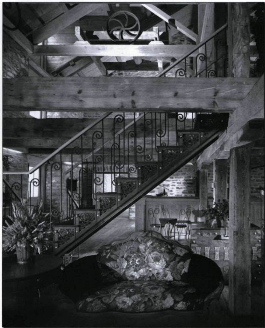
L'ancien entrepôt de John Chillas intégré aujourd'hui à l'Auberge Saint-Antoine.

Québec doit une grande partie de son développement aux activités portuaires que ses havres ont abritées depuis le début de l'implantation européenne. Le front fluvial en conserve et en révèle encore de signifiants témoignages. Les récents travaux d'agrandissement d'un des hôtels les plus réputés de la ville, l'Auberge Saint-Antoine, ont permis de mettre au jour de véritables trésors entre les rues