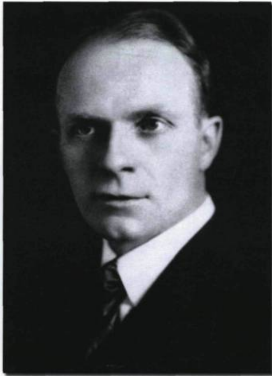
Adélard Godbout (1892-1956). Ministre de l'Agriculture dans le cabinet Taschereau (1930-1936); premier ministre de la province de Québec (11 juin 1936), il est défait deux mois plus tard, le 17 août 1936. Il est élu chef du Parti libéral en juin 1937. Il sera à nouveau premier ministre de 1939 à 1944. Programme-souvenir 25 anniversaire du Club de Réforme de Québec. Château Frontenac, le 7 novembre 1942.

équivaloir un vote à l'Union nationale à un vote pour la conscription. Mais elle s'explique également par le mauvais état des finances publiques et par la négligence de la machine partisane, une erreur que Duplessis ne commettra plus : le «duplessisme» des années 1944 à 1959 sera qualifié de «partitocratie». Son régime aura une emprise phénoménale sur la province qui accumulera un retard important en ce qui concerne ses institutions politiques.