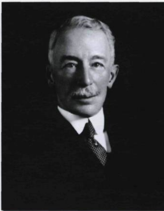
■ Louis-Alexandre Taschereau (1867-1952). Il fut premier ministre de la province de Québec de 1920 à 1936.

Le gouvernement Duplessis était donc aussi «libéral» que le régime Taschereau. Non pas qu'il aurait pu s'attaquer aux causes profondes de la crise économique, les instruments macroéconomiques étant entre les mains d'Ottawa et le budget de la province étant trop restreint pour stimuler la demande, mais il aurait pu tenter d'en atténuer certains effets, en commençant par mettre au pas les «trusts» de l'électricité. Mais pour Duplessis comme pour ses prédécesseurs, l'éco-