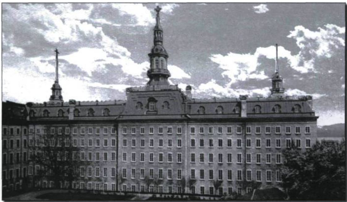
L'Université Laval, vers 1915. Carte postale J.-P. Gosselin. (Banque d'images de Cap-aux-Diamants).