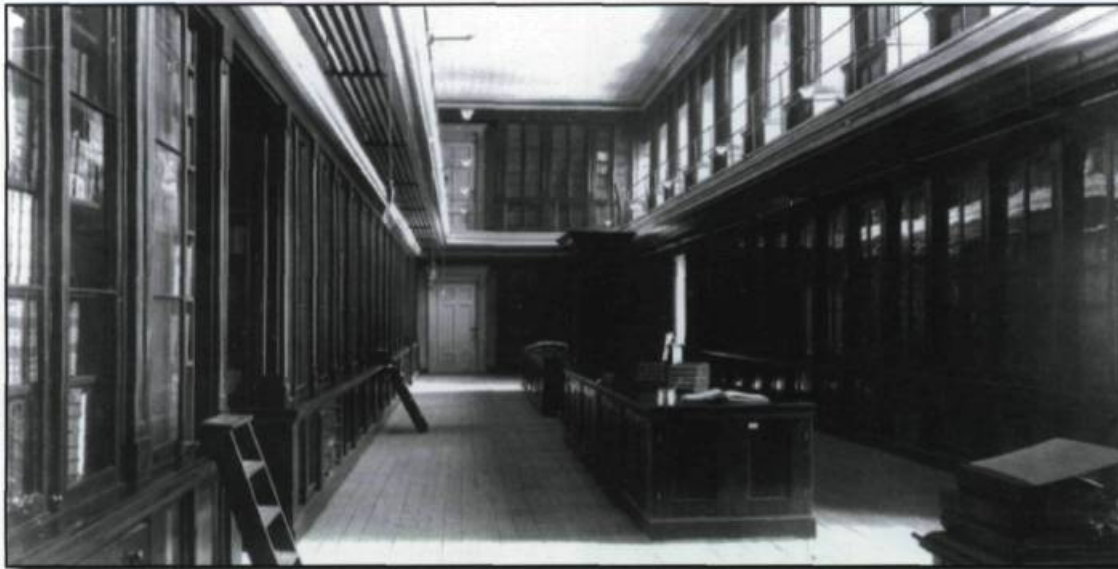
La bibliothèque de l'Université Laval en 1914.

domadaires pour le loisir familial. En 1895, ce dynamisme ambiant conduit à l'émergence de l'École littéraire de Montréal, association par laquelle Nelligan, entre autres, fait connaître son œuvre. Pour ce qui est des arts plastiques et de la musique, domaines où la frontière linguistique joue forcément beaucoup moins, la richesse économique de Montréal leur assure un marché relativement très actif. L'Art Association of Montreal, le Conseil des arts et manufactures et les concerts donnés au parc Sohmer ou les saisons de la Montreal Opera Company représentent des institutions sans équivalents à Québec.