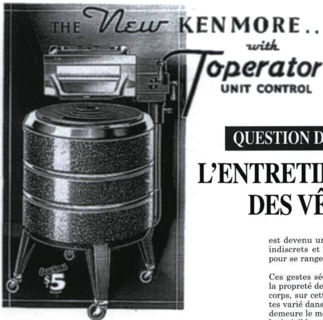
Kenmore Toperator, 1933. Dessinée par Henry Drezfuss et commercialisée par le catalogue Sears, la Toperator montre l'importance grandissante accordée au design des appareils ménagers. (Collection privée).