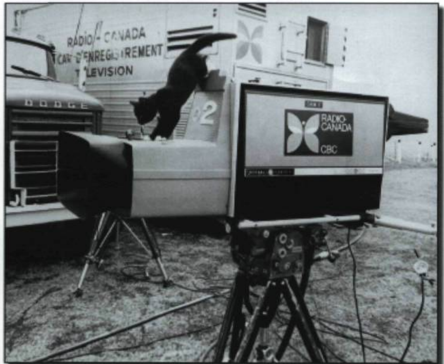
Début des émissions en couleurs au Canada, en 1966.