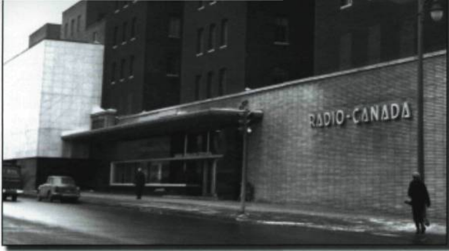
Entrée de CBC/Radio-Canada, boulevard Dorchester, à Montréal.

1935 : À Montréal, William Hoyt Peck, de Peck Television of Canada, met à l'essai durant cinq semaines un système de télédiffusion mécanique.