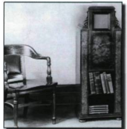
Un des premiers appareils récepteurs qui faisait la gloire des salons. ( Le Mémorial du Québec , Tome VI, p. 332).

1933 : Le système de télévision mécanique de la société Western Television Limited fait l'objet de démonstrations dans les magasins Eaton's à Toronto, Montréal et Winnipeg.