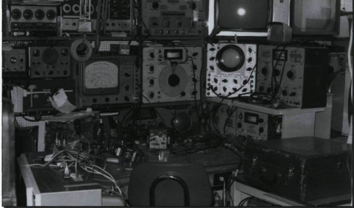
■ Atelier de Marcel Plante (intérieur), vers 1970.

devaient rester sur le balcon d'en avant : ils étaient tout simplement trop larges pour franchir le seuil de l'entrée et trop massifs pour circuler dans le couloir. La réparation devait avoir lieu sur le balcon et ce, même en hiver!