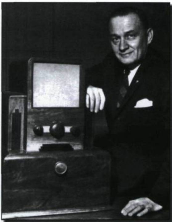
Alphonse Ouimet occupe la présidence de la société Radio-Canada de 1958 à 1967. (Archives nationales du film, de la télévision et de l'enregistrement sonore).

canadienne offerte et qu'il suffirait d'augmenter ou de faire respecter les quotas pour résoudre le problème du contenu canadien. Nos recherches démontrent plutôt que le recours aux émissions américaines depuis les origines de la radiodiffusion exprime une réalité culturelle bien ancrée dans la société canadienne et que la télévision québécoise, originale à ses débuts, demeure spécifique dans son enracinement. Comme toutes les autres, elle verse dorénavant dans le divertissement et ne constitue plus la même communauté culturelle qu'au temps des stations uniques alors que tous regardaient les mêmes émissions au même instant. Mais en dépit de ce fractionnement, l'offre et l'écoute marquent des différences considérables au Canada français et au Canada anglais où la culture populaire était déjà profondément américanisée avant que la télévision ne la diffuse si largement. Le palmarès des émissions est révélateur à cet égard : les plus écoutées à la télévision française sont toujours d'origine canadienne (c'est-à-dire québécoise), une situation que nous envient les nationalistes canadiens.