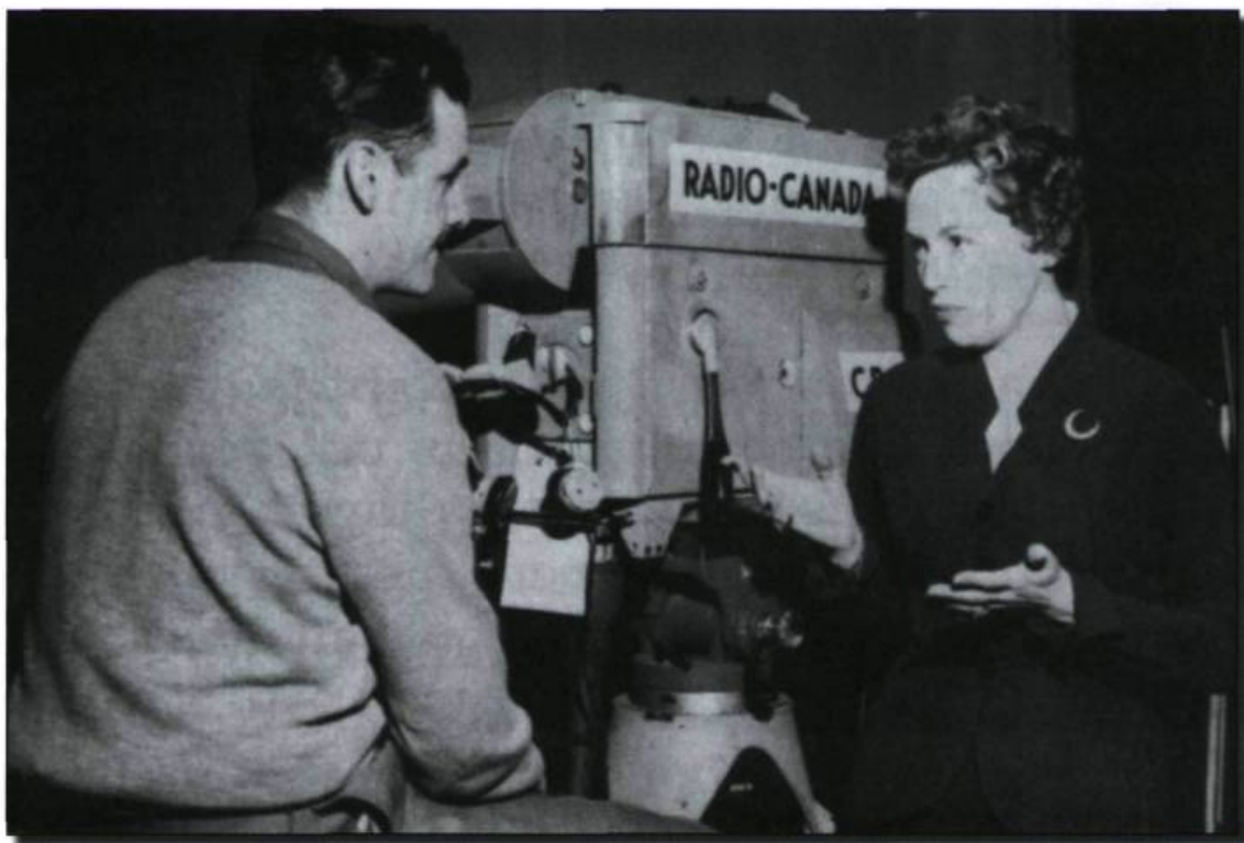
Michèle Tisseyre, première animatrice à la télévision ( Music-Hall , etc.).