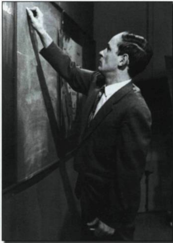
René Lévesque anime Point de mire , une émission d'affaires publiques à partir du 4 novembre 1956, à Radio-Canada. ( Horizon Canada , n° 62, p. 1 479).

Pour faire contrepoids à la commercialisation de la télévision qui s'amorce au début des années 1960, des règlements ont été imposés par les organismes de contrôle successifs, notamment en ce qui a trait aux quotas de programmes étrangers. Sans entrer dans les détails de cette réglementation complexe et changeante, on peut dire qu'elle a toujours échoué pour être trop