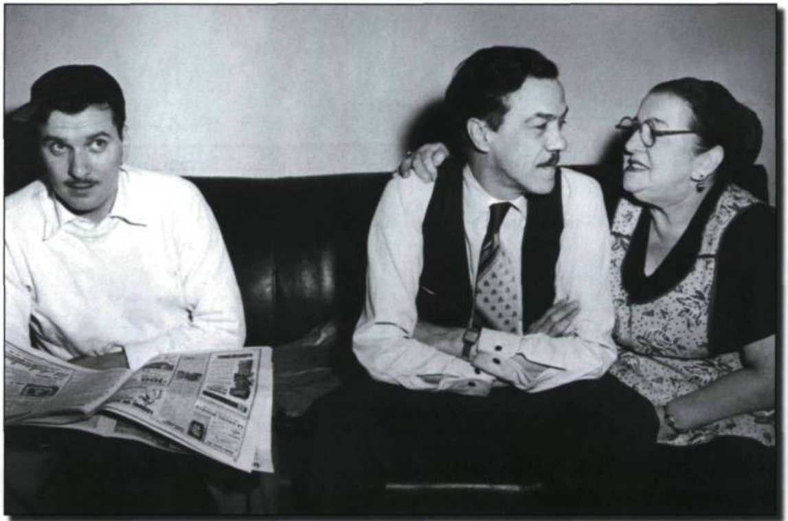
Des personnages comme il n'en existe nulle part ailleurs dans le monde : La Famille Plouffe.