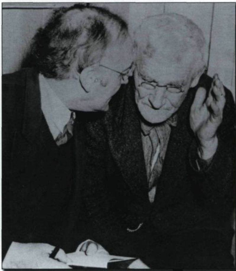
Marius Barbeau (1884-1969) a amassé des milliers de chansons traditionnelles. Ce trésor est conservé aujourd'hui au Musée canadien des civilisations, à Hull. Nous le voyons ici avec l'un de ses informateurs.

amènent bien au-delà de notre petite histoire nationale! Il y a eu galvaudage à cette époque en ce qui a trait aux connaissances sur la chanson et sur le folklore en général. Sans compter que cette immense poussée du folklore et du nationalisme a été suivie, dans les décennies subséquentes, d'un vide et d'un désintérêt total envers cet aspect de notre culture. Comme s'il y avait eu une surdose de cette matière véhiculée par les médias modernes et certaines de ses vedettes qui, sans la connaître réellement, l'ont jugée dépassée une fois que le mouvement nationaliste a commencé à diminuer. Pourtant, d'un point de vue scientifique, la chanson traditionnelle est loin d'avoir livré tous ses secrets. En fait, elle commence à peine à nous révéler une foule de choses sur l'histoire, les mœurs et les coutumes de ceux qui nous ont précédés.