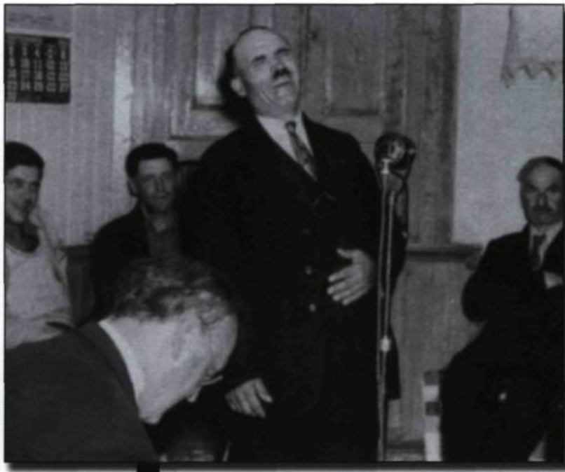
Un chanteur de chansons à répondre de la famille Ouellet de Saint-Paul-de-la-Croix, en 1941. Au premier plan, Marius Barbeau. Dans Marius Barbeau I Have Seen Quebec , Québec, Garneau, 1957.

Y.B. : Est-ce qu'il y a des chansons qui ont été créées au XIX e siècle, soit dans le domaine politique ou autre et que l'on peut considérer comme traditionnelles?