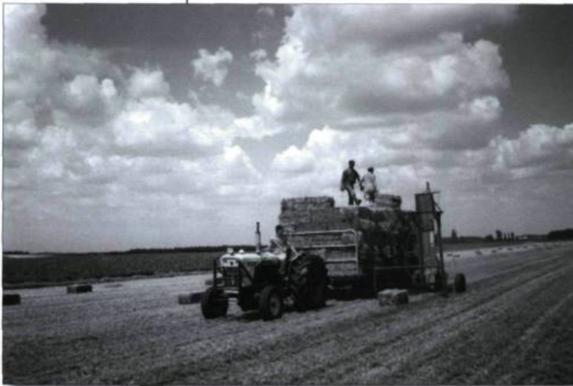
La fenaison à la ferme Beau-Regard à Saint-Eugène-de-Grantham (Drummond), à l'été 2000. (Photographie Yves Beaugard).

SRC : Secrétariat rural canadien (relève du ministère de l'Agriculture et de l'Agroalimentaire du Canada)