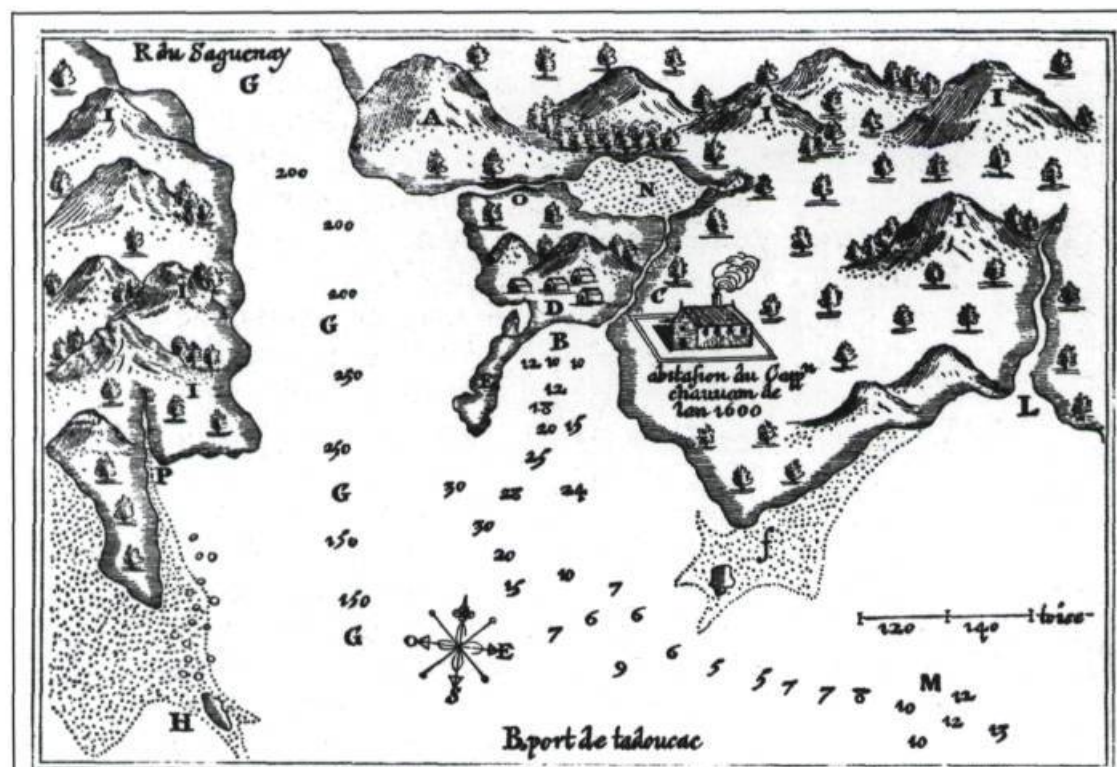
Les chiffres montrent les brasses d'eau.

Le 24 mai 1603, Samuel de Champlain débarque à Tadoussac en compagnie d'Aymar de Chaste, le nouveau détenteur du monopole. S'il est déçu par le port de Tadoussac, trop petit à son goût, et par les terres environnantes, trop escarpées, c'est pourtant là qu'est scellé le sort des Français dans la vallée du Saint-Laurent.