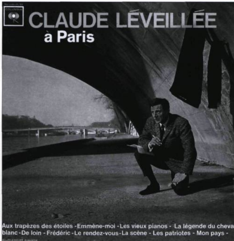
L'album Claude Léveillée à Paris, de la compagnie Columbia.