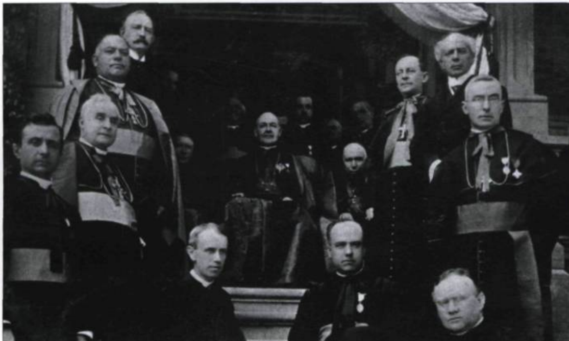
Quelques invités de prestige au Congrès eucharistique de Montréal, en 1910. (Sir Thos.-G. Shaughnessy, l'archevêque Bourne, sir Wilfrid Laurier, l'archevêque Bruchési, monseigneur Haylen, le cardinal Logue, le cardinal Vannutelli, le cardinal Gibbons...). Carte postale Illustrated Post Card Co. Montreal, 1910. (Collection Yves Beauregard).

Chose certaine, l'époque fut anticommuniste, et l'Église catholique prit la tête du combat. Époque de militants, témoin l'Action catholique. On