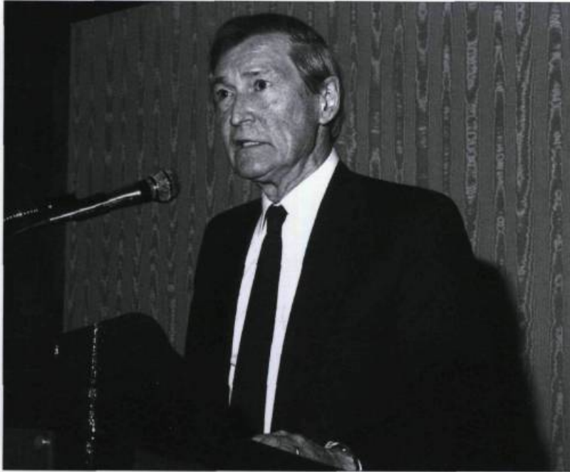
Fernand Dumont (1927-1997), sociologue, essayiste, poète. Il a publié de nombreux ouvrages à partir de 1952.

La Révolution tranquille et le concile Vatican II furent bien l'ère de tous les ébranlements. Feu l'unanimité, chambardement de la liturgie, nouvelle catéchèse, mouvement œcuménique, nouvelle approche de la morale ou de la vie conjugale : le clergé lui-même, cardinal Paul-Émile Léger en tête, prônait le changement. Après l'euphorie du concile (1962-1966), il en vit peut-être plus qu'il n'en avait souhaité...