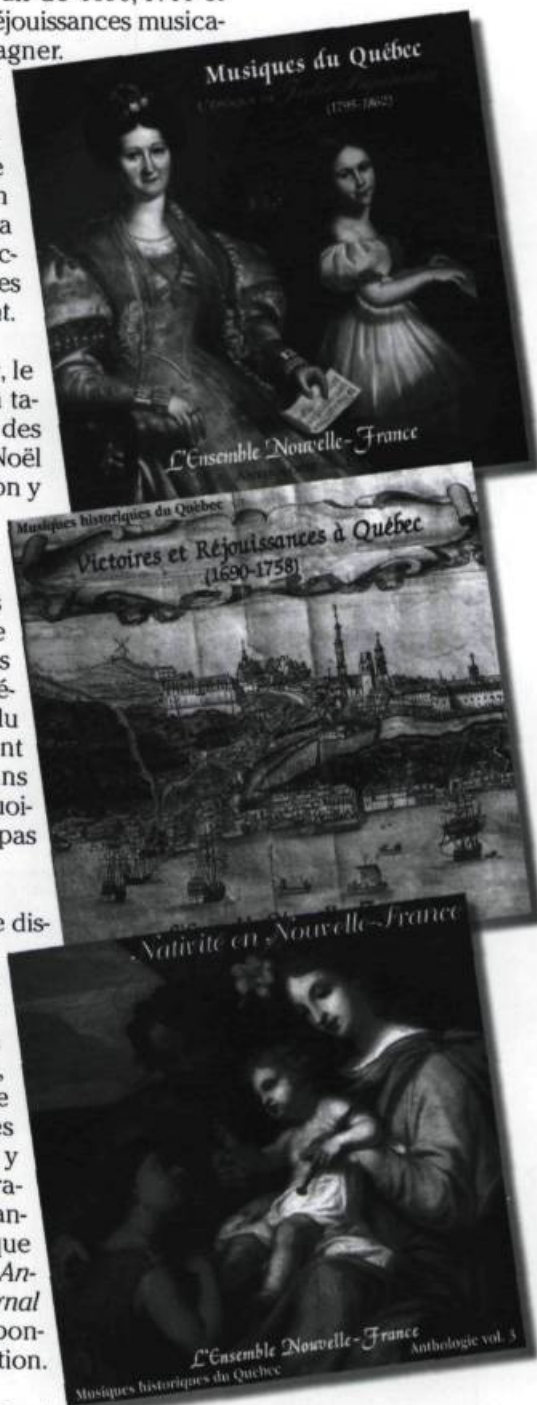
Pochettes des volumes 1, 2 et 3 de l'anthologie de la musique historique du Québec.

Le volume 4 de l'anthologie, L'Épopée mystique , est consacré aux manuscrits anonymes des premières ursulines et augustines de Québec et au