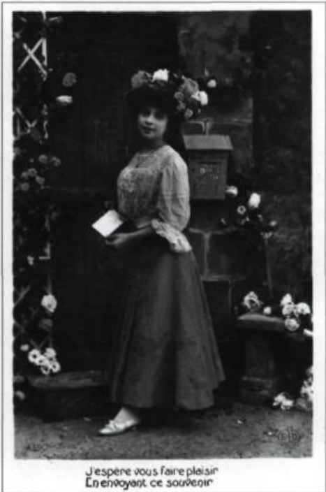
Belle carte postale romantique du début du XX e siècle soulignant le rôle de la correspondance dans les relations amoureuses de l'époque.