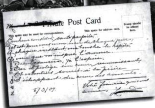
Cartes postales romantiques du début du XX e siècle.

le couple est distinct de la famille et de la communauté, les amoureux se définissent une existence propre et valorisent leur intimité. Auparavant, l'amour était un chemin. Cette fois, il est un moyen de parcourir ce chemin. Cette nuance marque l'amorce d'un renversement de la vision déterministe. L'amour devient «contrôlable», c'est un moyen de parcourir l'existence. Après les années 1950, la nature permet de décrire les caractéristiques individuelles des amoureux : le partenaire est une rivière, un océan, une étoile, un soleil, un nounours, un lapin, un minou, une chouette, etc.