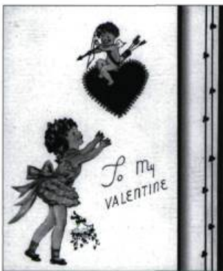
Carte pour la fête de la Saint-Valentin vers 1930-1940. Envoi anonyme avec points d'interrogation.

Il est à noter que, dans ce travail nominatif du conjoint, ce n'est pas la parenté au sens large qui est ici présente, mais plutôt la famille immédiate (père, mère, frère et sœur). Cela s'observe aussi dans la complémentarité des rôles des acteurs : on n'est pas d'abord homme ou femme, mais frère, sœur, père ou mère. Il est d'ailleurs significatif que le vocabulaire désignant le couple, de manière autonome, soit à peu près absent de cette première série de lettres. En effet,