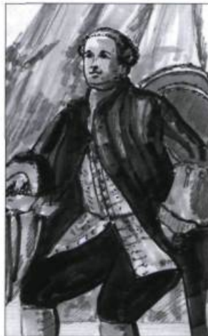
Sir William Phips. (Illustration : ministère de la Culture et des Communications).

T n août 1690, Increase Mosley monte à bord de l'un des navires de la flotte de l'amiral Phips. Il périt en mer, à l'anse aux Bouleaux, dans l'actuelle municipalité de Baie-Trinité sur la Côte-Nord, au retour de l'expédition contre Québec. Sa femme Sarah, enceinte d'un fils au moment de son départ, attendra jusqu'en 1703 pour se remarier.