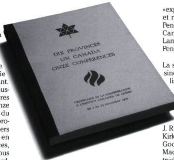
Ouvrage publié par L'Institut Canadien pour diffuser les dix conférences du centenaire de la Confédération tenues sous les auspices de L'Institut. Photographie Brigitte Ostiguy, 1998. (Archives de L'Institut Canadien).

«L'Institut poursuit ainsi sa mission culturelle et pense contribuer de cette façon à sa vocation spirituelle et sociale, partant à l'unité du pays» avait déclaré le D r Lachance en ouvrant la session. Pour atteindre ce but, il avait invité onze personnalités canadiennes-anglaises «les plus éminentes et les plus représentatives de chacune des dix provinces», avait-il ajouté.