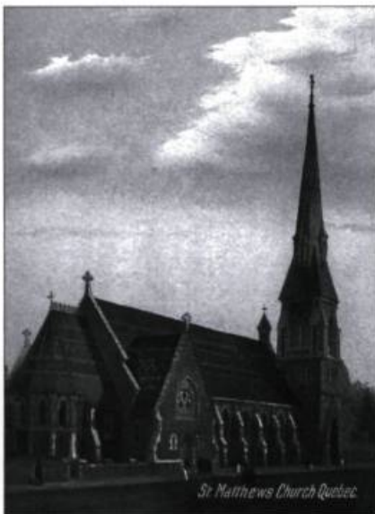
L'ancienne église est ornée de contreforts et dominée par la tour de son clocher. Vue de la rue Saint-Jean. Carte postale European Post Card Co., Montréal, vers 1905. (Collection Yves Beauregard).

En réaction au matérialisme croissant du XIX e siècle, les ecclésiologistes rejetèrent l'architecture de l'époque précédente. Cette architecture reflétait, selon eux, l'érosion graduelle des valeurs spirituelles dans l'Église anglicane depuis la Réforme. Les ecclésiologistes axèrent principalement leurs efforts sur l'architecture des petites églises paroissiales, voyant en celles du Moyen-Âge l'image d'une époque où la vie en Angleterre était bien meilleure. Ils croyaient déterminer un havre de grâce dans les cités surpeuplées et matérialistes du XIX e siècle.