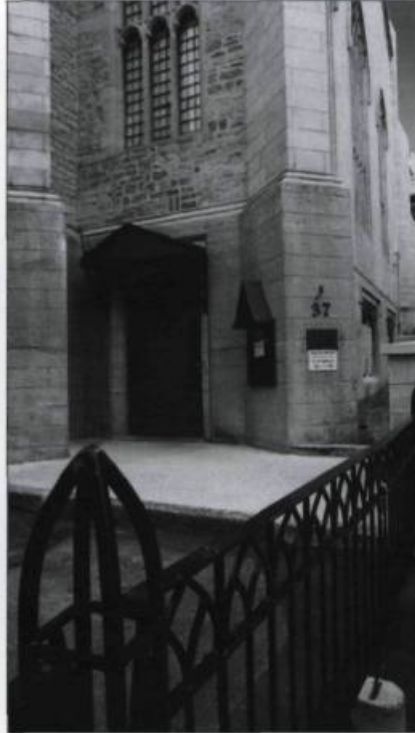
L'entrée de la bibliothèque Vieux-Québec, rue Sainte-Angèle.