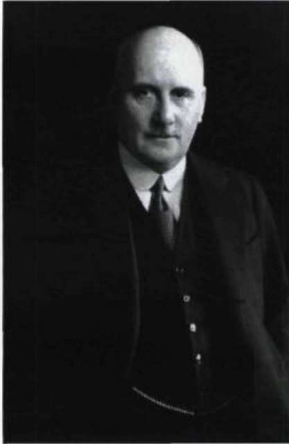
Le sénateur Lorne C. Webster souhaitait la sauvegarde de l'ancienne église Wesley. (Archives de L'Institut Canadien).

telle salle. L'absence d'arrière-scène limitait considérablement les possibilités de représentations. Le nouveau plancher de béton suit l'inclinaison originale de l'ancienne église. Il aurait fallu une déclivité plus importante pour assurer une bonne visibilité. L'étroitesse du vestibule de l'ancienne église convient difficilement