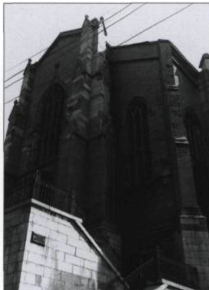
De style néogothique, l'ancienne église Wesley domine la côte de la rue Saint-Stanislas depuis 1848.

fermé et en remplaçant quelques rayons de livres par des aires de lecture supplémentaires. L'installation d'un faux plafond permet de camoufler une tuyauterie trop visible. L'extérieur du bâtiment a également subi des transformations. L'ancienne maçonnerie de l'avant-corps, qui suscitait de nombreux problèmes, est re-