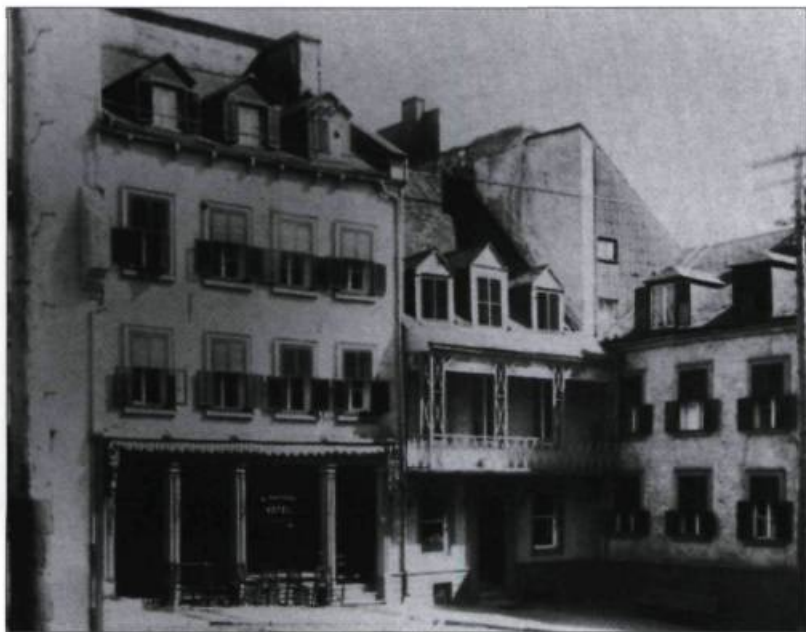
L'hôtel Blanchard de la place Royale où se réunirent les fondateurs de L'Institut Canadien et qui devint plus tard l'hôtel Louis XIV. (Collection privée).

E n janvier 1848, avait lieu dans l'ancienne salle de la bibliothèque du Parlement, la fondation de L'Institut Canadien de Québec. Par sa longévité et par son retentissement, cette société qui a marqué profondément la ville de Québec attire notre attention parce