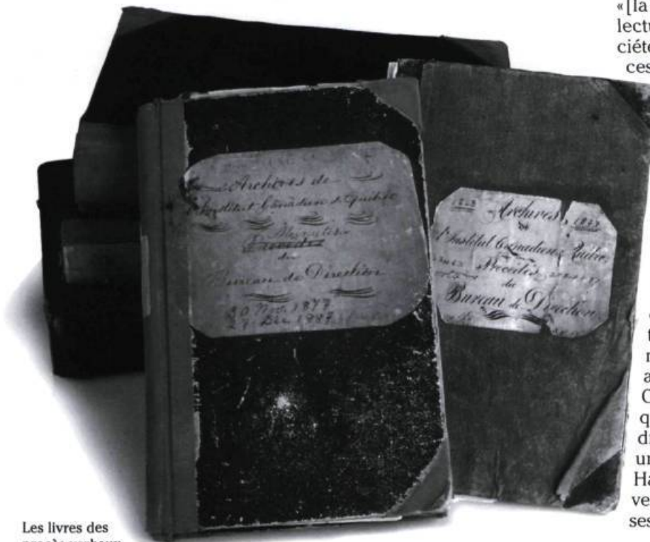
Les livres des procès-verbaux du «bureau de direction» de L'Institut Canadien. Photographie Brigitte Ostiguy, 1998. (Archives de L'Institut Canadien).

relles, fait figure de doyen. La plupart des autres membres sont dans la vingtaine. Tous désirent se prendre en main pour parfaire leur culture et perfectionner leur art oratoire tout en servant la communauté. En effet, d'après le modèle du