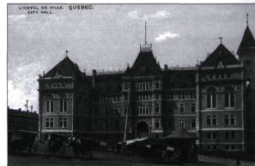
À l'hôtel de ville, la bibliothèque de L'Institut Canadien était située dans l'aile du côté droit, au-dessus du bureau du maire. Carte postale du début du XX e siècle.

1875 Zéphirin Cantin devient le premier gardien à plein temps de la bibliothèque de L'Institut. / Célébrations à L'Institut du 100 e anniversaire de l'assaut de Québec par les troupes du général Richard Montgomery. / Première aide financière du gouvernement de la province de Québec.