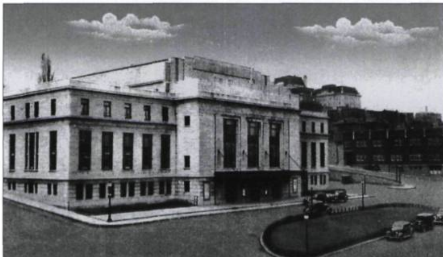
Avec bonheur, L'Institut Canadien s'installe en 1932 dans le tout nouveau Palais Montcalm. Carte postale, Librairie Garneau ltée..

1932 L'Institut s'installe dans le nouveau Palais Montcalm, à la place d'Youville. / L'Institut a désormais son Livre d'Or.