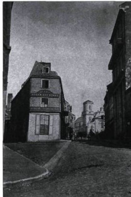
La croisée de la rue Garneau et de la côte de la Fabrique. Du côté droit, le haut édifice de L'Institut Canadien.

1871 Sous la présidence du marchand Théophile Ledroit, les finances de L'Insti-