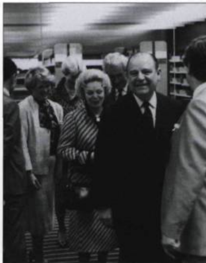
Raymond Barre, premier ministre de France, visite la nouvelle bibliothèque Centrale, en 1983. (Archives de L'Institut Canadien).

1985 La bibliothèque Centrale devient la bibliothèque Gabrielle-Roy. / Ouvertures des bibliothèques Saint-Albert, Saint-