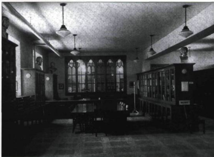
La salle de lecture de L'Institut Canadien en 1948, au rez-de-chaussée de l'ancienne église Wesley. (Photographie tirée de l'ouvrage Les cent ans de L'Institut Canadien de Québec , Québec, 1949).

1898 Inauguration des salles et de la bibliothèque de L'Institut à l'hôtel de ville. / Célébrations du 50 e anniversaire. / Parution du quatrième catalogue de la bi-