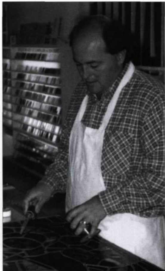
Économusée du vitrail. (Archives de la Fondation des économusées).

d'économusée fait actuellement ses preuves. Le réseau compte 24 entreprises réparties dans huit régions du Québec — et une au Nouveau-Brunswick — et constitue un circuit touristique de plus en plus apprécié des visiteurs. La Fondation des économusées développe et gère le réseau en sélectionnant les projets, en fournissant aux entreprises l'expertise nécessaire à leur transformation et en faisant la promotion du circuit auprès des agences touristiques et du public.