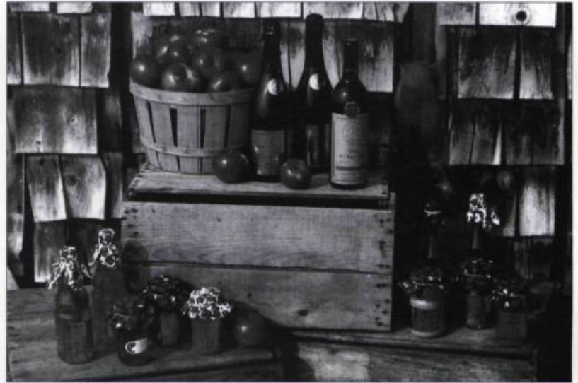
Économusée de la pomme. Photo : Jean-Pierre Vachon, 1996. (Archives de la Fondation des économusées).

Généralement, dès son entrée, le visiteur voit déjà l'atelier et les artisans qui s'activent : c'est le cœur de l'économusée. Le gros de sa visite se passera à cet endroit. Sur son parcours pour aller à la boutique, des espaces seront réservés à la présentation d'informations et d'objets anciens démontrant l'évolution historique du métier ou de pièces contemporaines illustrant les pratiques actuelles. Pour ceux qui sont avides