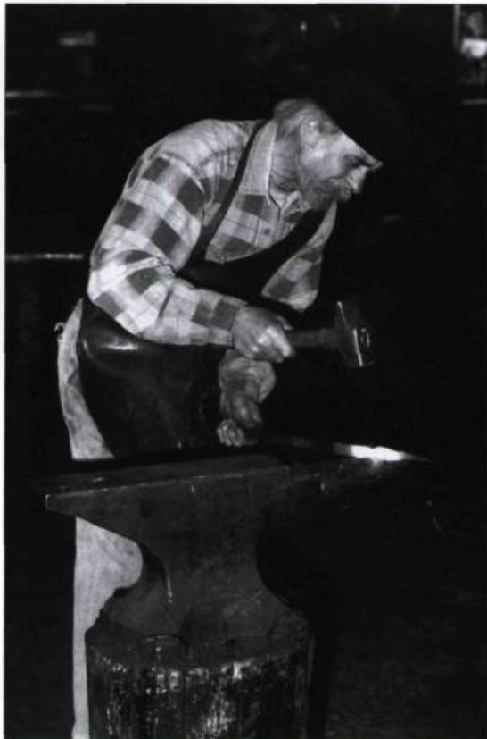
Économusée de la forge. Photo : Jean-Pierre Vachon, 1996. (Archives de la Fondation des économusées).

A u Québec et dans la plupart des pays industrialisés, la perte des savoir-faire traditionnels s'est faite de façon régulière et rapide depuis la Deuxième Guerre mondiale. Moins spectaculaire que la destruction de bâtiments, la disparition de ces métiers et de ces techniques ne se fait pas toujours sentir de façon immédiate.