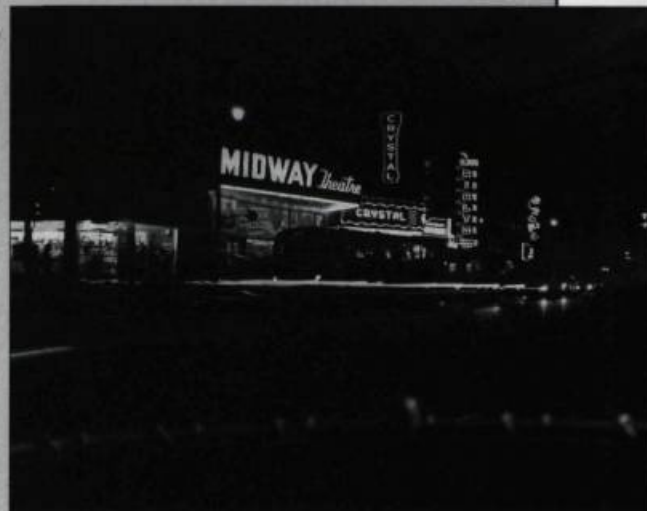
Le théâtre Midway sur le boulevard Saint-Laurent à Montréal fut longtemps un lieu de rencontre pour les homosexuels. Photographie : Ville de Montréal, 1972. (Archives de Line Chamberland).

Depuis les années 1920, les hommes homosexuels ont utilisé divers espaces publics pour nouer des contacts sociaux et sexuels : rues, parcs, cinémas, installations sportives, restaurants. L'analyse des dossiers judiciaires montréalais des années 1930 révèle une multiplication des arrestations d'homosexuels, souvent à la suite de guet-apens policiers, sur le mont Royal ainsi qu'au théâtre Midway sur la rue Saint-Laurent. La période 1945-1960 représente une transition entre la clandestinité et l'émergence visible de la communauté gaie qui va suivre. Outre les partys privés dans des locaux loués, il existait deux noyaux de sociabilité publique : l'univers de la Main , éloquentement dépeint par Michel Tremblay, et le centre-ville, davantage fréquenté par des francophones et des anglophones de classe moyenne qui préféraient la discrétion et la respectabilité des bars d'hôtels comme le Piccadilly Club à l'hôtel Mont-Royal et le bar Maritime du Ritz-Carlton. Pour les individus, le partage de ces espaces sociaux jouait un rôle important dans le cheminement vers l'acceptation de soi et l'identification avec des pairs du monde gai. Au niveau collectif, les bars ont permis aux gais de développer une culture spécifique et un sentiment d'appartenance communautaire à travers le partage d'un même univers de préoc-