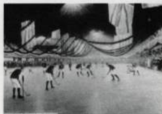
« Partie de hockey, patinoire Victoria 1893 ».

« Les grands prix de l'Institut de Design de Montréal »