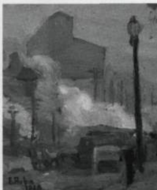
Ernest Aubin : « Rue des Commissaires », 1928. (Coll. Jean-Albert Contant)

« Peindre à Montréal 1915-1930 : les peintres de la Montée Saint-Michel et leurs contemporains »