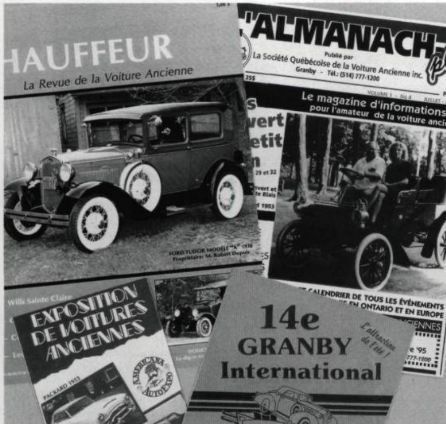
Les amateurs de véhicules anciens peuvent adhérer à de nombreux clubs au Québec et même aux États-Unis. Ces derniers publient des revues et organisent des rencontres et des marchés aux puces.

dizaine de véhicules anciens. Parlez-moi des principales activités qui retiendront l'attention des amateurs québécois en 1996.