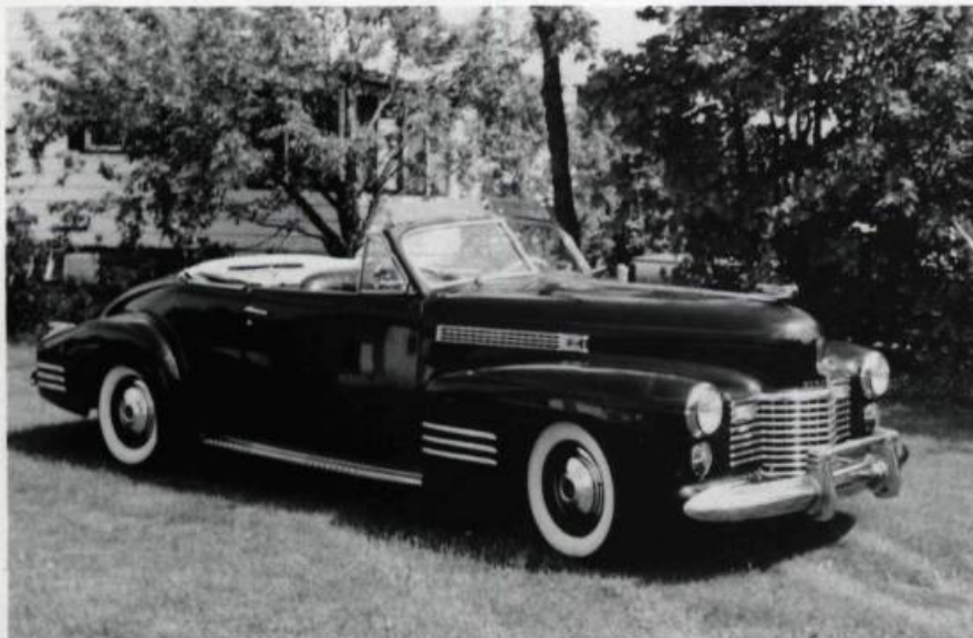
Cadillac 1941 (décapotable). Il n'existe que 60 exemplaires de ce modèle. Ce dernier a été acheté en Californie.

à peu, j'ai acquis de l'expérience par la pratique et je me suis documenté à l'aide de revues spécialisées, de certains volumes et de catalogues anciens.