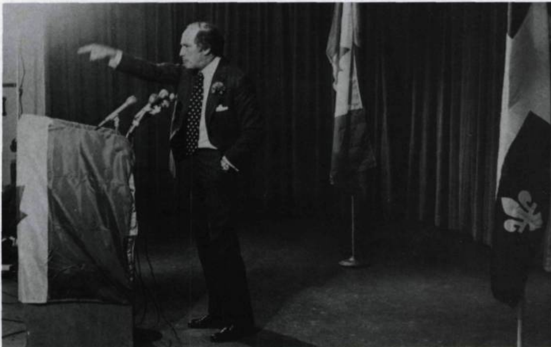
Le mieux préparé à faire face à la situation est, sans contredit, le premier ministre du Canada, Pierre Elliott Trudeau. On lui offre une occasion en or de mâter les forces indépendantistes!

pour se rendre au camp Bouchard, non loin de Montréal, avec à bord des militaires. Par un curieux hasard, (Georges Bernanos a écrit que «le hasard est la providence des imbéciles») ces militaires doivent participer à une opération appelée Night Hawks .