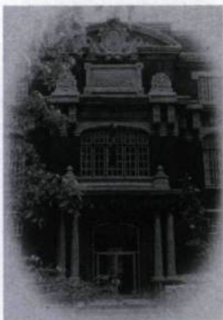
LE CENTRE DE PRODUCTION ARTISTIQUE ET CULTURELLE ALYNE-LEBEL