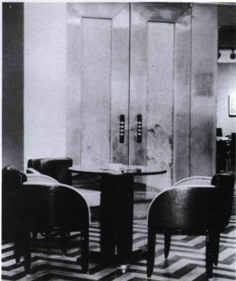
Fumoir de la salle à manger du restaurant le 9 e chez Eaton en 1976.

l'on trouvait sur les paquebots de croisière de l'entre-deux-guerres. À cette fin, l'architecte Jacques Carlu s'est inspiré de la salle à manger de l' Île-de-France , lancé par la compagnie française French Line en 1927. Le trait d'union entre