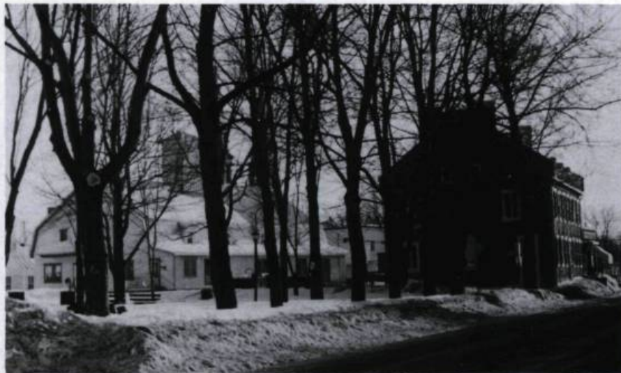
Située à l'arrière de la Maison nationale des Patriotes, la meunerie a été construite en 1940 par Adréus Bonnier.

L'entreposage et la mouture du blé, du maïs, de l'orge et de l'avoine se poursuivent jusqu'à la fin des années 1970.