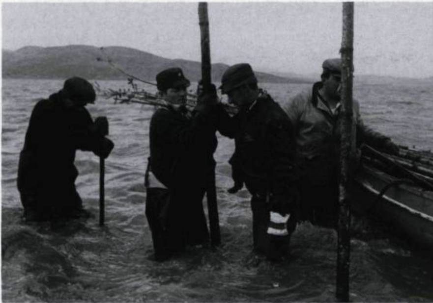
Scène tirée de «Pour la suite du monde» de 1963. Michel Brault a coréalisé ce film avec Pierre Perrault pour le compte de l'ONF. Photo: Office national du film du Canada. (Coll. Yves Laberge).

angulaire plutôt qu'au téléobjectif. Cela soulevait des tas de questions sur l'influence de la présence d'une caméra sur le milieu.