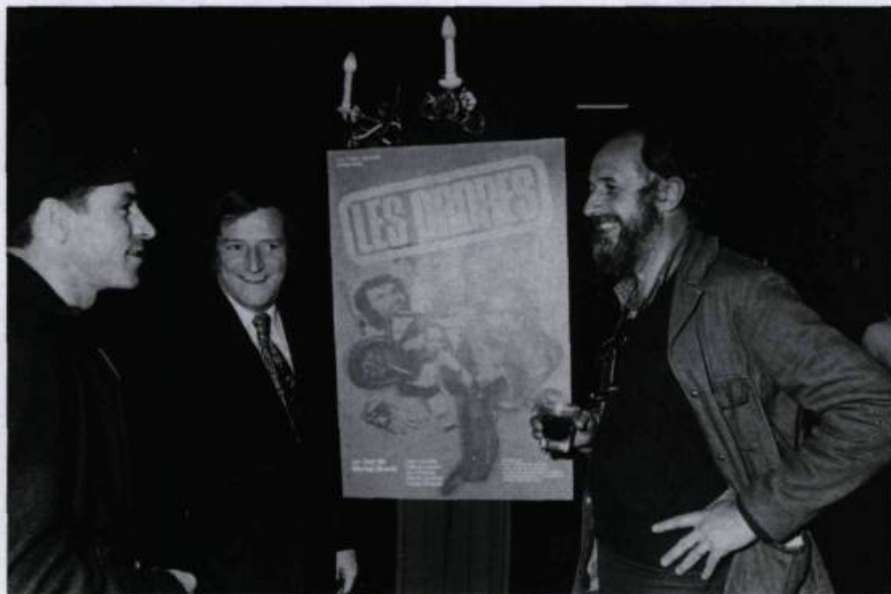
En 1974, Michel Brault réalise, pour les Productions Prisma, le film «Les Ordres» inspiré des événements de la Crise d'octobre 1970. Sur cette photographie prise lors du lancement du film, Brault apparaît (à droite) en compagnie de deux des principaux acteurs, Claude Gauthier et Jean Lapointe.

Il faut le fabriquer pièce par pièce. On a commencé le tournage de Mon oncle Antoine assez tard en hiver. Il n'y avait plus un brin de neige. C'était dégueulasse à Thetford Mines. Une vieille neige sale traînait. J'étais désespéré. L'équipe de production a dû commander 25 camions de neige pour le lendemain matin, premier jour de mars et premier jour de tournage. Le lendemain, au réveil, il y avait un pied de belle neige blanche tombée durant la nuit. On a donc allègrement annulé les camions de neige. On a tourné les scènes d'hiver pendant tout le mois de mars. On a du s'arrêter parce que le financement n'était pas terminé. Il y a eu les élections, une campagne électorale. La première campagne électorale du Parti québécois à laquelle j'ai participé pendant le mois de mai 1970. Puis, on a repris notre tournage au mois de juin. On ne savait même pas si on allait avoir assez de sous pour finir le film! Puis, au montage durant l'été, on s'est aperçu que le film avait certaines lacunes. On ne comprenait pas très bien l'histoire du cercueil, etc. Alors, l'hiver suivant, au mois de décembre, dès qu'il y a eu de la neige, on est retourné à Thetford Mines et on a tourné d'autres scènes. Finalement, on s'est aperçu que le film avait un certain intérêt. Vous comprenez qu'en le faisant on ne savait pas très bien si on allait réussir ou pas. Surtout pas que ce serait un «grand film» comme vous dites. Un film n'existe que lorsque le public le voit.