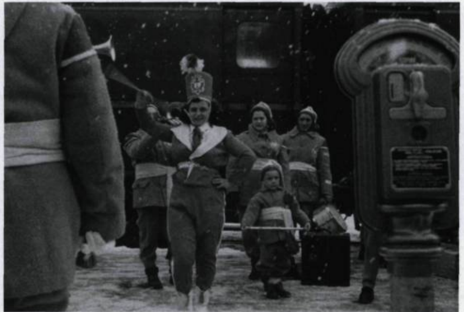
«La différence de se savoir filmé». En 1958, Michel Brault, l'un des pères du «cinéma direct», tourne «Les Raquetteurs» en collaboration avec Gilles Proulx.

L'évolution de la technique a été une des conditions essentielles à la réalisation de ce genre de films. À cette époque, il était impensable de filmer les gens sur le vif, les équipements étaient beaucoup trop lourds. Les caméras et les magnétophones avaient été dessinés pour faire des