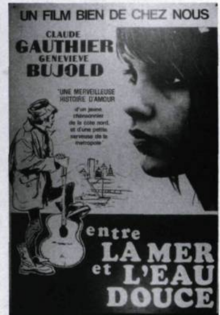
Affiche du film de Michel Brault «Entre la mer et l'eau douce» avec Claude Gauthier et Geneviève Bujold, 1967.