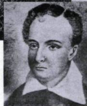
Philippe Aubert de Gaspé (fils), (1814-1841), journaliste et écrivain.