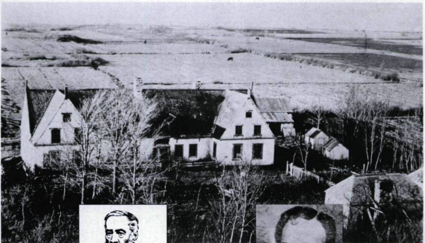
Le manoir de Saint-Jean-Port-Joli au début de ce siècle.

Or, rien ou presque à Saint-Jean-Port-Joli ne rappelle leur mémoire, si ce n'est une plaque commémorative érigée en 1927. On se soucie peu au Québec de mettre en valeur nos écrivains