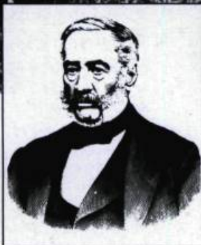
Philippe Aubert de Gaspé (1786-1871), avocat, seigneur et écrivain. Gravure d'après une photographie.