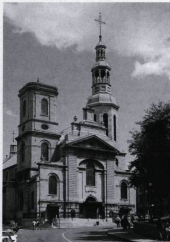
La basilique-cathédrale Notre-Dame-de-Québec, haut lieu de l'histoire religieuse du pays, a été récemment reconnue comme site de pèlerinage dédié à François de Laval. Photo: Brigitte Ostiguy, 1992. (Archives de «Cap-aux-Diamants»).

dans le clergé, préfèrent laisser à d'autres la croyance au merveilleux qui s'y manifeste. Ils tourneront même en ridicule le recours aux reliques, à l'eau bénite ou aux huiles dont l'usage leur paraît relever plutôt de la magie ou de la superstition. La thèse en anthropologie d'Anne Doran-Jacques sur Sainte-Anne-de-Beaupré permet de saisir le sens du pèlerinage, à partir du