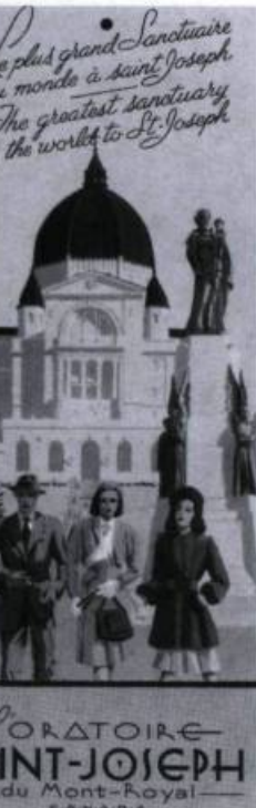
Dépliant promotionnel de l'Oratoire Saint-Joseph de Montréal, vers 1955. (Coll. Jean-Marie Lebel).

des chapelets en 1879, pont de glace qui s'est formé sur le Saint-Laurent à la fin de mars et qui a permis de transporter durant huit jours la pierre nécessaire à la construction de la nouvelle église du Cap, le prodige des yeux en 1888, où la statue de la Vierge, dont les yeux étaient fermés, les ouvre pendant dix minutes environ. Des Annales sont fondées en 1892 et, en 1902, le pèlerinage est confié à la congrégation des oblats de Marie-Immaculée. Il atteint sa maturité en 1904, alors que le pape accorde le privilège du couronnement à la statue.