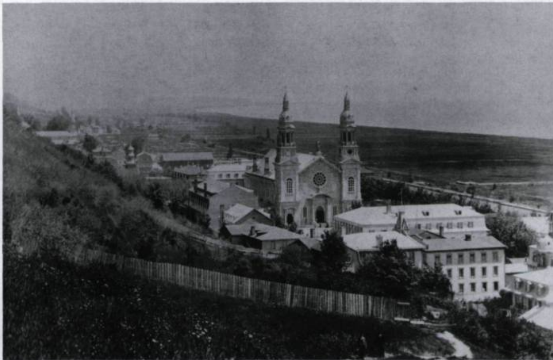
Érigée en 1872, la quatrième église de Sainte-Anne-de-Beaupré devint la première basilique en 1887 et fut incendiée le 29 mars 1922.

d'une nouvelle église. C'est le début d'un mouvement officiel où tout le Québec est associé au pèlerinage. Ce mouvement connaîtra son point culminant en 1876, alors que sainte Anne est proclamée patronne de la province de Québec. La création des Annales de la Bonne Sainte-Anne de Beaupré en 1873 contribue puissamment à répandre la dévotion. Le nombre de pèlerins va sans cesse croissant: on en compte 40 000 durant l'été 1877. Les prêtres séculiers ne pouvant plus suffire à la tâche, M gr Elzéar-Alexandre Taschereau, archevêque de Québec, décide de confier le sanctuaire à une congrégation religieuse: les rédemptoristes belges prendront charge du sanctuaire en 1879. Jusqu'à la fin du siècle, celui-ci connaîtra un essor considérable. En 1887, Taschereau, devenu le premier cardinal canadien, couronne la statue de la sainte en présence de huit évêques, 250 prêtres et 10 000 fidèles. Autre manifestation du même genre en 1889, à l'occasion de la consécration de la basilique. Avec l'arrivée du chemin de fer en 1889, le nombre de pèlerins grimpe à 100 000; il y a alors plus de cent pèlerinages organisés par année. En 1892, l'arrivée de la Grande Relique — une partie du bras de sainte Anne ramenée de Rome par M gr Calixte Marquis — fut un autre événement de grande envergure.