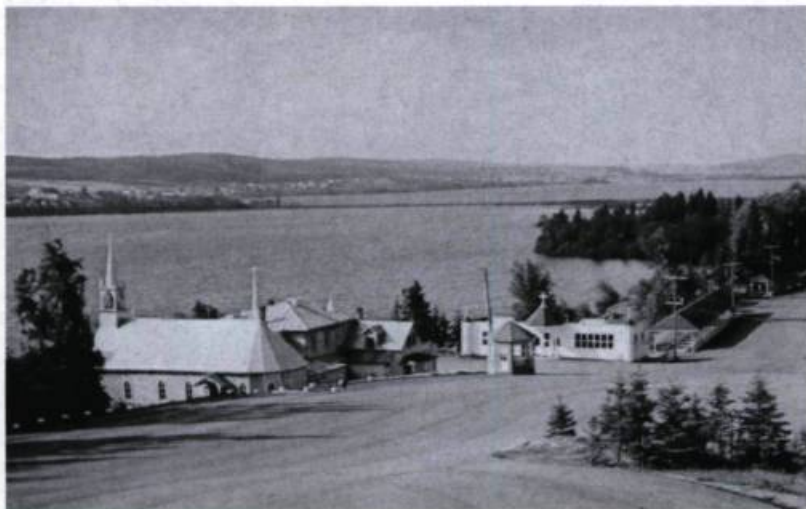
Pèlerinage à Notre-Dame de Lourdes et à Saint-Antoine, Lac-Bouchette, au sud du lac Saint-Jean. Carte postale d'Alex Wilson. (Coll. Jean-Marie Lebel).