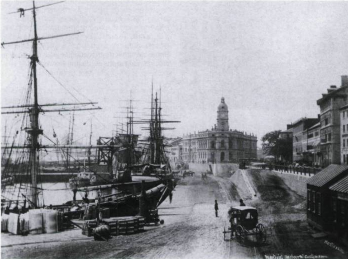
Le port de Montréal à la fin du XIX e siècle. À l'arrière-plan, le Royal Insurance Company Building.

Comme on peut s'en rendre compte, les interventions faites depuis une décennie pour conserver et mettre en valeur l'environnement bâti du Vieux-Montréal sont nombreuses, variées et, dans l'ensemble, pertinentes et de bonne qualité. À cette liste, il faut ajouter le réaménagement