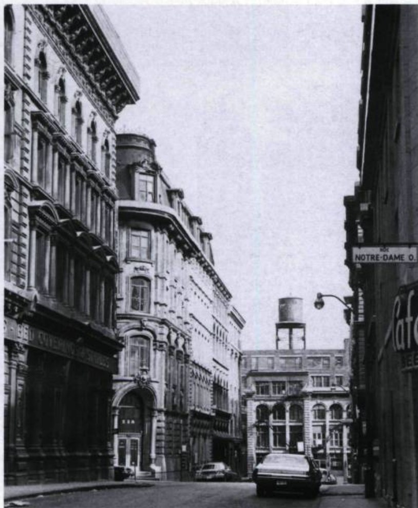
Le Vieux-Montréal, un centre-ville de la période industrielle: la rue Sainte-Hélène.

Cette volonté de retrouver un Vieux-Montréal davantage de caractère vernaculaire, voire d'esprit français, est présente depuis le début et a été à l'origine de plusieurs propositions visant à recréer un environnement disparu. L'une d'entre elles a bien failli être réalisée. En effet, en 1976, le ministre des Affaires culturelles avait pris position en faveur du projet des sœurs grises, qui