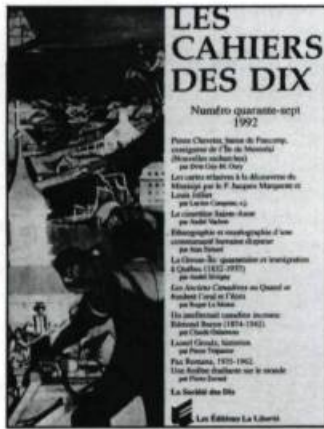
Les Cahiers des Dix (n° 47). Sainte-Foy: Les Éditions La Liberté, 1992, 340 p.

C'est à un Canadien français né à Berthier-en-Haut en 1874, Edmond Buron, que l'on doit d'avoir rendu à la lumière l' Imago Mundi , l'ouvrage du cardinal d'Ailly qui, en bonne partie, influença et poussa Christophe Colomb à découvrir l'Amérique. Un exemplaire de l' Imago Mundi , annoté par Colomb lui-même, dormait dans une urne de cristal à la bibliothèque colombienne de Séville. Œuvrant de jour aux Archives publiques du Canada à Paris et faisant du journalisme de nuit (il fut à l'emploi, entre autres, du Petit parisien ), Buron consacra quinze années de loisirs à la traduction et à l'étude de l' Imago Mundi . Il déchiffra aussi les 900 annotations de Colomb. Sa traduction en trois volumes totalisant 828 pages parut à Paris en 1930 et lui valut la reconnaissance des milieux savants. Mais, plus tard, isolé et oublié, Buron mourut dans la misère en 1942 durant la Seconde Guerre mondiale. Il avait été forcé de mettre au mont-de-piété sa précieuse médaille d'or reçue de la Société de géographie pour sa contribution à la connaissance de l' Imago Mundi et de Colomb. C'est ce que nous apprend l'historien Claude Galarneau dans un article des nouveaux Cahiers des Dix où il nous retrace la carrière de cet «intellectuel canadien inconnu».