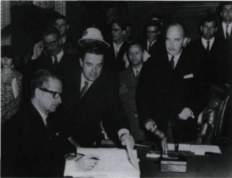
Assermentation de Daniel Johnson comme premier ministre du Québec. Le 5 juin 1966, l'Union nationale prend le pouvoir avec 56 députés.

Daniel Johnson était-il vraiment indépendantiste? Comment ne pas s'interroger en effet avec pareil slogan? Mais il faut mettre des bémols à son indépendantisme car il visait avant tout une réforme en profondeur du régime fédéral où les Québécois seraient traités sur un pied d'égalité, utopie ancienne qui défie la réalité canadienne mais dont se nourrissent, depuis des lunes, nationalistes traditionnels ou partisans du fédéralisme renouvelé.