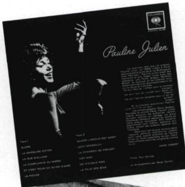
Pauline Julien (1963): une grande interprète des chansonniers québécois. (Microsillon Columbia FL 290: collection de l'auteur).