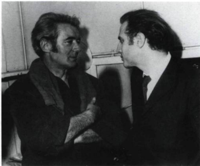
Les deux géants de la chanson du Québec: Félix Leclerc et Gilles Vigneault (1967).

C'est dans cette fertilité bouillonnante qu'apparaît, vers 1960, le phénomène généralisé des boîtes à chansons. Grande bénédiction culturelle, artistique et sociale qui coïncide avec l'émergence de notre «Révolution tranquille».