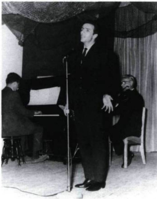
Gilles Vigneault à ses débuts dans une boîte à chansons décorée de filets de pêche (1960).

Dès 1960, des boîtes de prestige comme «la Boîte à chansons de la porte Saint-Jean» (Vieux-Québec) ou la «Butte-à-Mathieu» (Val-David) existent. Une troisième, d'envergure, «le Patriote» (Montréal), apparaît plus tard. Mais, même pour les boîtes plus modestes et moins renommées, l'imagination est au pouvoir et nous assistons à une véritable prolifération bienheureuse, autant pour la débrouillardise d'organiser un local pittoresque que pour la créativité de lui trouver un nom.