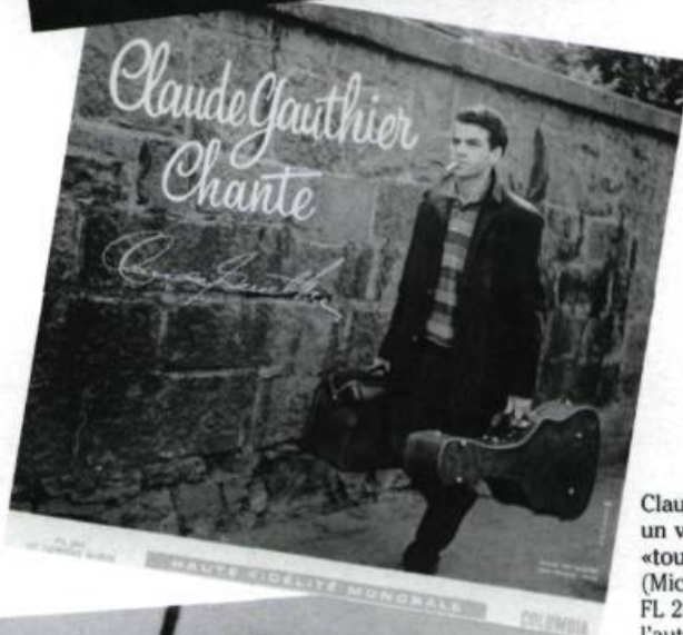
Claude Gauthier (1961): un vrai pionnier de la «tournée des boîtes». (Microsillon Columbia FL 284: collection de l'auteur).