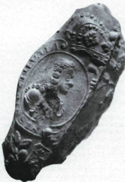
Pipe à effigie princière probablement anglaise, de la fin du XVIII e siècle ou du début du XIX e siècle, provenant du poste de traite de Chicoutimi.