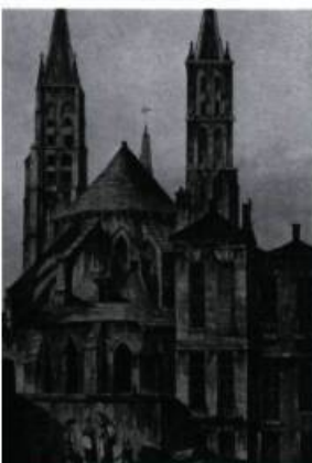
Le 6 décembre 1658, François de Laval est consacré évêque de Pétrée dans la chapelle de la Vierge de l'abbaye de Saint-Germain-des-Prés à Paris. Illustration de J. Hill d'après un dessin de J.C. Natter, vers 1810. (Archives de l'abbé Jean-Marie Thivierge).